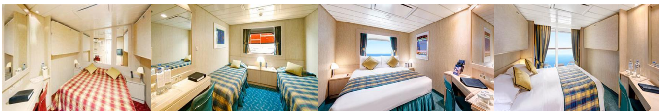
CABINA EXTERIOARA CU BALCON